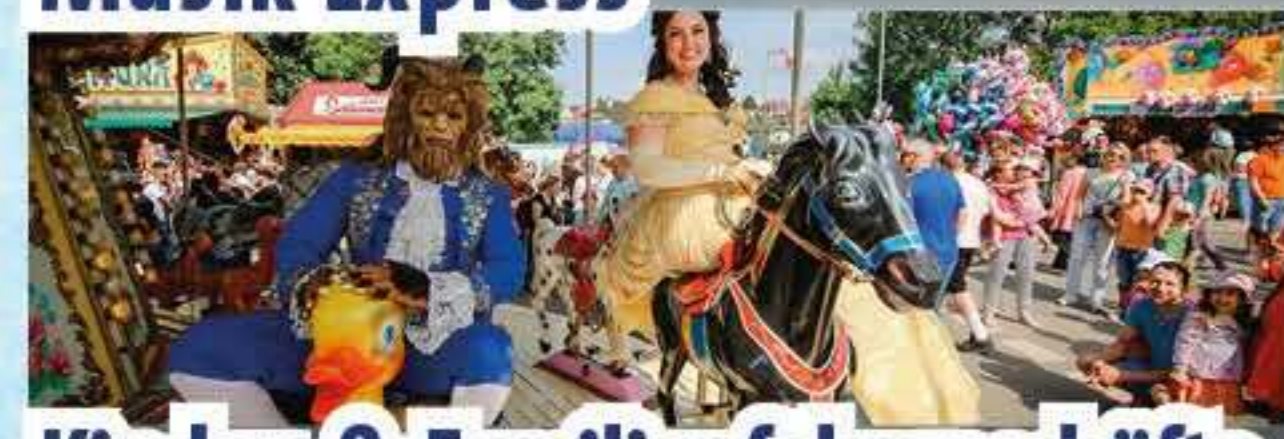
Kinder- & Familienfahrgeschäfte