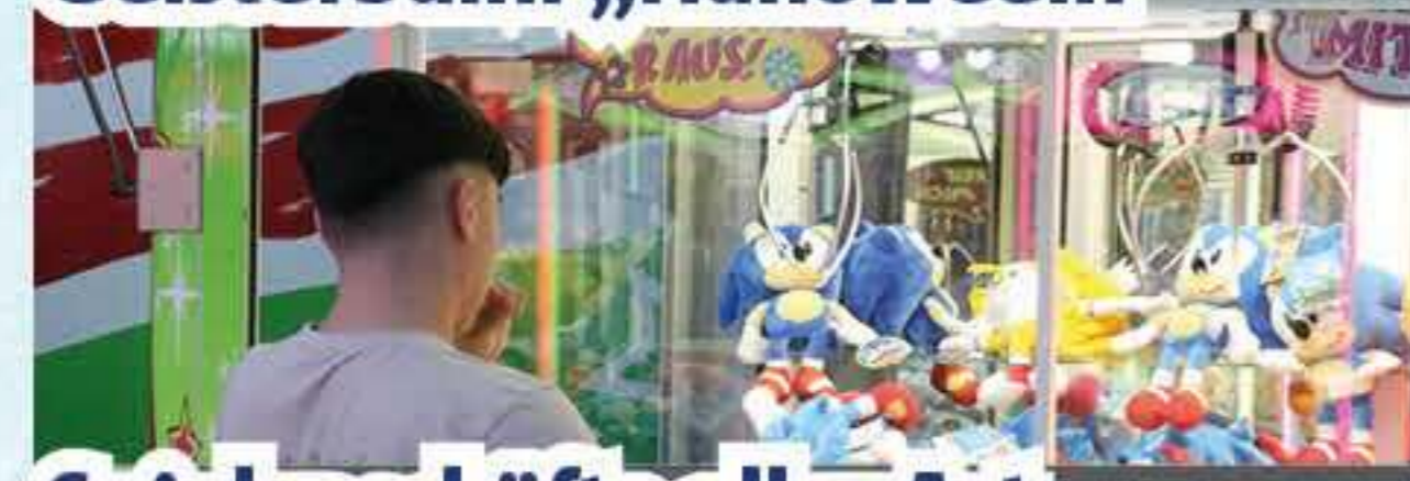
Spielgeschäfte aller Art