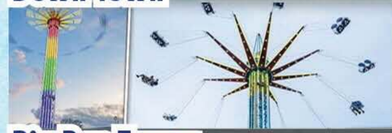
Big Ben Tower