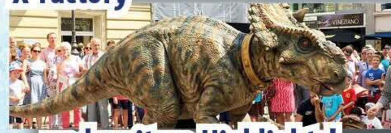
... und weitere Highlights!